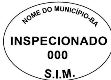
Modelo 2: 5x3cm