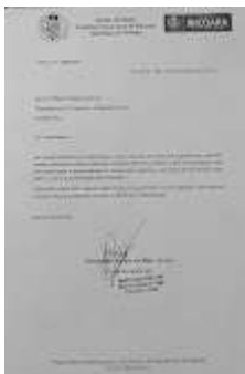
Ofício 158-2023 Consórcio Chapada Forte.jpg 64K